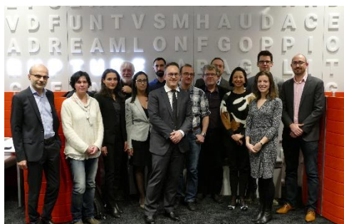
Lauréats 2018 Preuve du Concept CLARA

Le financement de ces trois nouveaux projets représente une subvention publique totale de 951 000 € apportée par les collectivités locales. Celles-ci réaffirment ainsi leur soutien à l'économie de la connaissance : Région Auvergne-Rhône-Alpes (357 464 €) ; Métropole de Lyon (315 000 €) et Grenoble Alpes Métropole (278 606 €). Les entreprises partenaires Cellenion (Lyon), Sofradir (Grenoble) et Nano-H (Lyon) prévoient de réaliser de leur côté un investissement de 951 520 €.