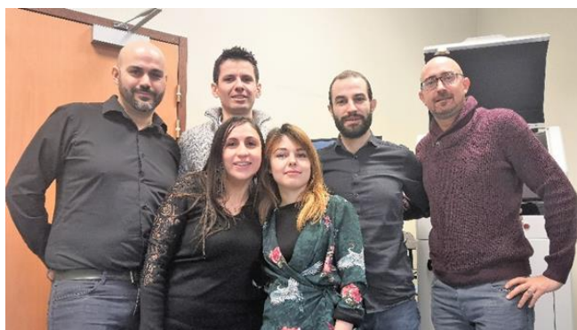
L'équipe Cellenion, basée à Lyon, est composée de 6 Ingénieurs et chercheurs