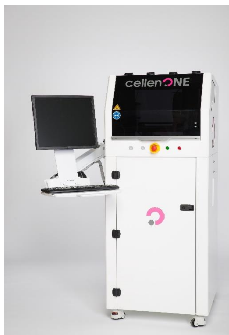
La machine cellenONE actuellement commercialisée par cellenion

Impact medico économique : Le programme Preuve du Concept CLARA représente une première étape afin de valider la faisabilité d'une nouvelle approche. Le projet PELICAN permettra ainsi à Cellenion de démontrer les bénéfices de sa technologie cellenONE® sur une nouvelle source de biopsie liquide. Pour le Centre Léon Bérard, cela permettra de participer à l'émergence de techniques diagnostiques plus performantes et moins invasives et ainsi améliorer le taux de rémissions des patients. Plus largement pour la région AuRA et la France, ce programme, en adéquation avec l'initiative France Génomique 2025, s'inscrit dans les développements nécessaires pour améliorer la prise en charge du patient et la maîtrise des coûts de santé.